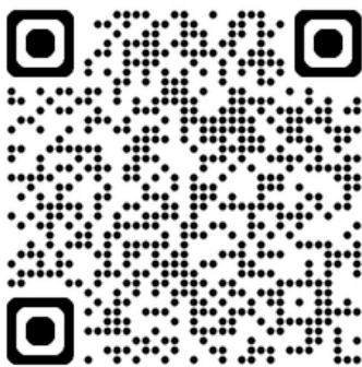
Sur notre site internet